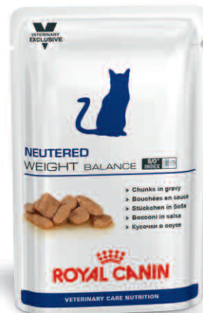
Frischebeutel: 100 g

Ein synergistischer Antioxidanzienkomplex aus Vitamin E, Vitamin C, Taurin und Lutein hilft, freie Radikale zu neutralisieren.